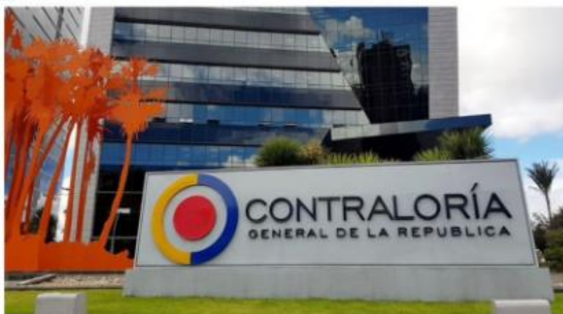
A los ciudadanos nos corresponde alzar la voz para no permitir que nos arrebatan la esperanza de instituciones íntegras.

Es imperativo suspender procesos viciados